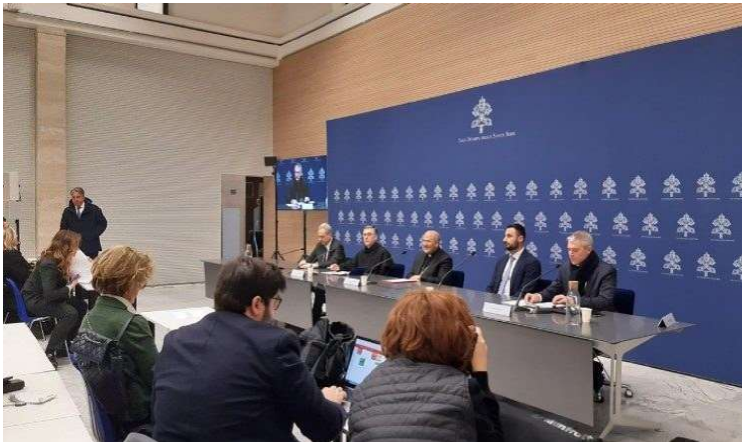
PLANLEGGING: Pressekonferansen i Vatikanet i forkant av Verdensbarnedagen.

Kom, Jesus, du som gjør alt nytt, du som er veien, som fører oss til Faderen, kom og bli hos oss alltid. Amen.