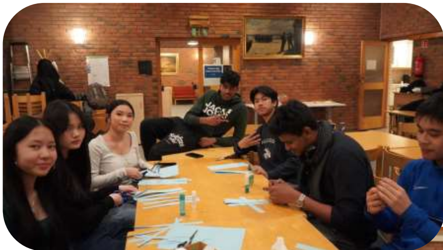
Hilsen styret i ST. JO

Vi i ST. JO ønsker dere alle en god og velsignet påskehøytid!