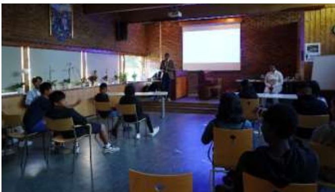
Game Show 23. juni