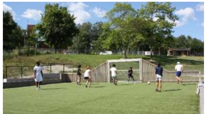
Idrettsdag 3. juli