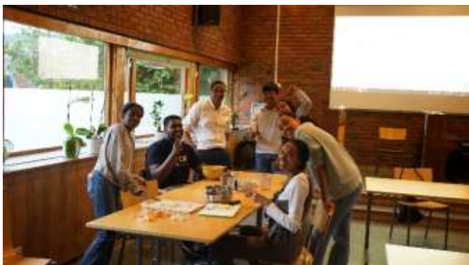
Make Your Own Pizza Night 10. juli