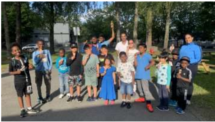
Sportsdag 7. juli