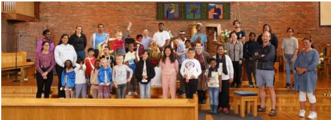
Olavspel 29. juli