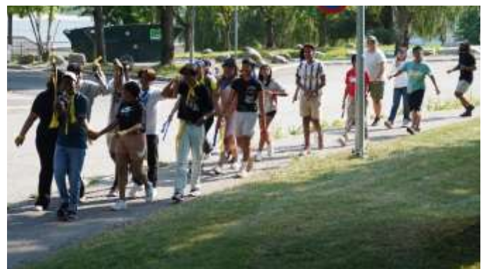
Sommer OL og matfestival 23. juli