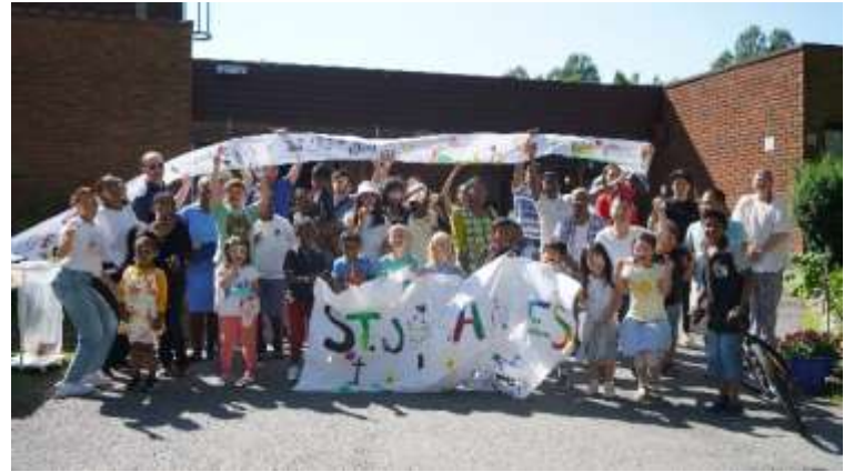
Barnas Dag 15. juli